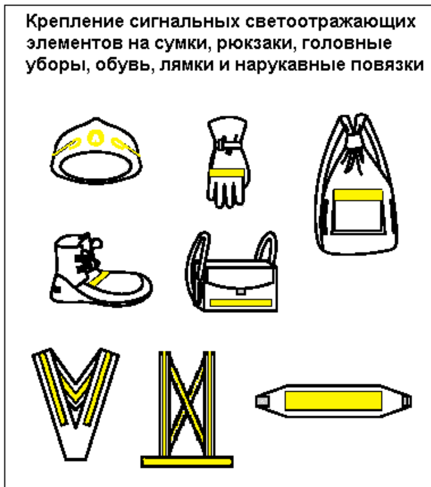
Рис.2. Крепление сигнальных светоотражающих элементов на сумки, рюкзаки, головные уборы, обувь, ляжки и нарукавные повязки.