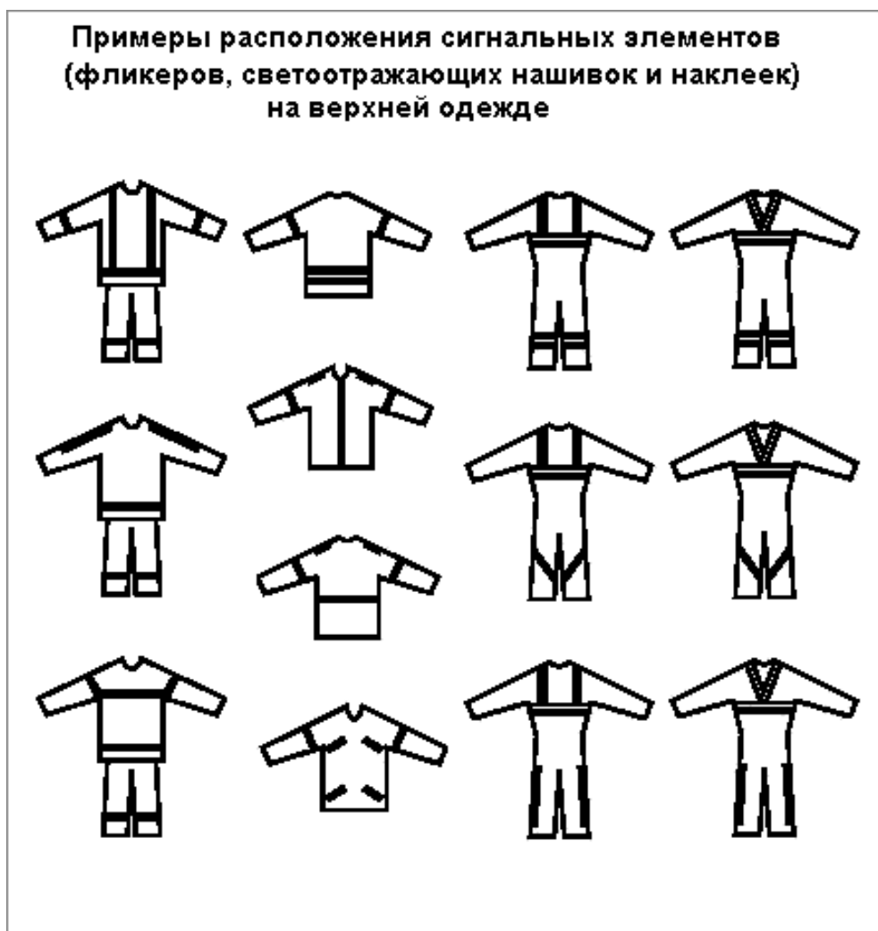
Рис.1. Примеры расположения сигнальных элементов (фликеров, светоотражающих нашивок и наклеек / лайтскотча) на верхней одежде.

световозвращающая краска-спрей (из баллончиков), самоклеющаяся плёнка или производится печать люминесцентным красителем.