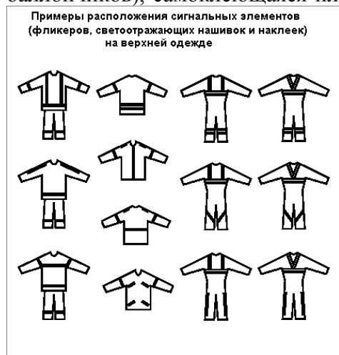
Рис.1. Примеры расположения сигнальных элементов (фликеров, светоотражающих нашивок и

Стандартная ширина световозвращающих лент, пригодных для самостоятельного оформления своих вещей, одежды - 12, 25 и 50 миллиметров. На слабо освещённой улице - поможет и самодельный фликер, из подручных материалов, например, белый лист обычной писчей или глянцевой бумаги, поднятый повыше (чтобы было видно с любой стороны), сумка поярче или цветастый целлофановый пакет, посветлее. При наличии и возможности, на сигнальные поверхности, заранее наносится световозвращающая краска-спрей (из баллончиков), самоклеющаяся плёнка или производится печать люминесцентным красителем.